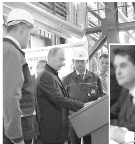
А ТАКЖЕ ПРЕМЬЕР ПРОВЕЛ СОВЕЩАНИЕ ПО ВОПРОСУ «О СОСТОЯНИИ И МЕРАХ ПО РАЗВИТИЮ ЧЕРНОЙ МЕТАЛЛУРГИИ».

24 ИЮЛЯ В ХОДЕ РАБОЧЕЙ ПОЕЗДКИ В ЧЕЛЯБИНСКУЮ ОБЛАСТЬ ПРЕДСЕДТЕЛЬ ПРАВИТЕЛЬСТВА В.В. ПУТИН ПРИНЯЛ УЧАСТИЕ В СИМВОЛИЧЕСКОМ ЗАПУСКЕ ЕДИНСТВЕННОГО В РОССИИ КОМПЛЕКСА ПО ПРОИЗВОДСТВУ ТОЛСТОЛИСТОВОГО ПРОКАТА НА МАГНИТОГОРСКОМ МЕТАЛЛУРГИЧЕСКОМ КОМБИНАТЕ. КОМПЛЕКС БУДЕТ ПРОИЗВОДИТЬ ВЫСОКОРЕТАБЕЛЬНЫЙ ПРОКАТ С ПОВЫШЕННОЙ КАТЕГОРИЕЙ ПРОЧНОСТИ ДЛЯ НЕФТЕГАЗОВОЙ ОТРАСЛИ, СУДО- И МАШИНОСТРОЕНИЯ.