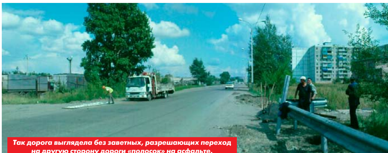
Так дорога выглядела без заветных, разрешающих переход на другую сторону дороги «полосок» на асфальте.

Недавно по Магистральному шоссе в районе конечной остановки 33-го автобуса был оборудован пешеходный переход. Для кого-то это может показаться незначительным событием, но для жителей близлежащих домов, особенно работников ОАО «Амурметалл», которым ежедневно на свой страх и риск приходилось переходить улицу с оживлённым автомобильным движением, это событие очень обрадовало. И теперь нет необходимости ждать, пока пройдёт вереница авто, особенно утром, когда все спешат на работу.