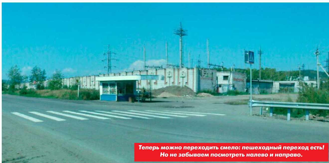
Теперь можно переходить смело: пешеходный переход есть! Но не забываем посмотреть налево и направо.