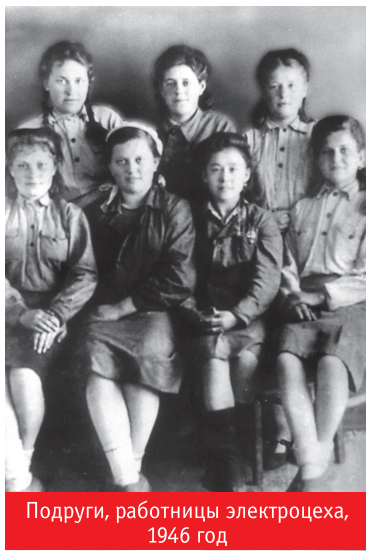
Подруги, работницы электроцеха, 1946 год