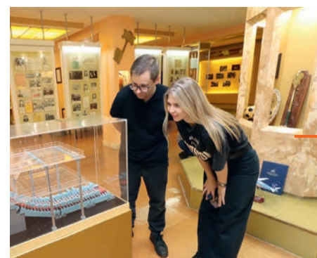
Гости и участники конгресса посетили завод «Амурсталь» и побывали в Музее трудовой славы