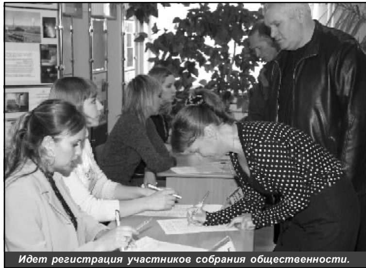
Идет регистрация участников собрания общественности.

дут направлены на строительство автодорог, водозапорных сооружений, взлётно-посадочных полос, объектов жилищно-коммунального хозяйства и социальной сферы. По городу Комсомольску-на-Амуре поступления по этой программе составили в 2006 году 35 млн. руб. В этом году ожидается 20 млн. руб., а в 2008 году — уже 150 млн. руб. Эти средства направлены на важные объекты нашего города: реконструкцию реабилитационного центра для детей, строительство канализационной насосной станции «Центральная», комплекса обезжелезизания и деманганации вод Амурского водозабора в пласте, противотуберкулезного диспансера, спортивного центра в Центральном округе. Всё это было достигнуто благодаря целенаправленной работе президента России во взаимодействии с депутатами Государственной Думы, партией «Единая Россия» и депутатами Хабаровской законодательной Думы, среди которых есть и представители нашего предприятия — А.Г. Шишкин и С.А. Хохлов, органами государственной власти, субъектами российской федерации и местного самоуправления.