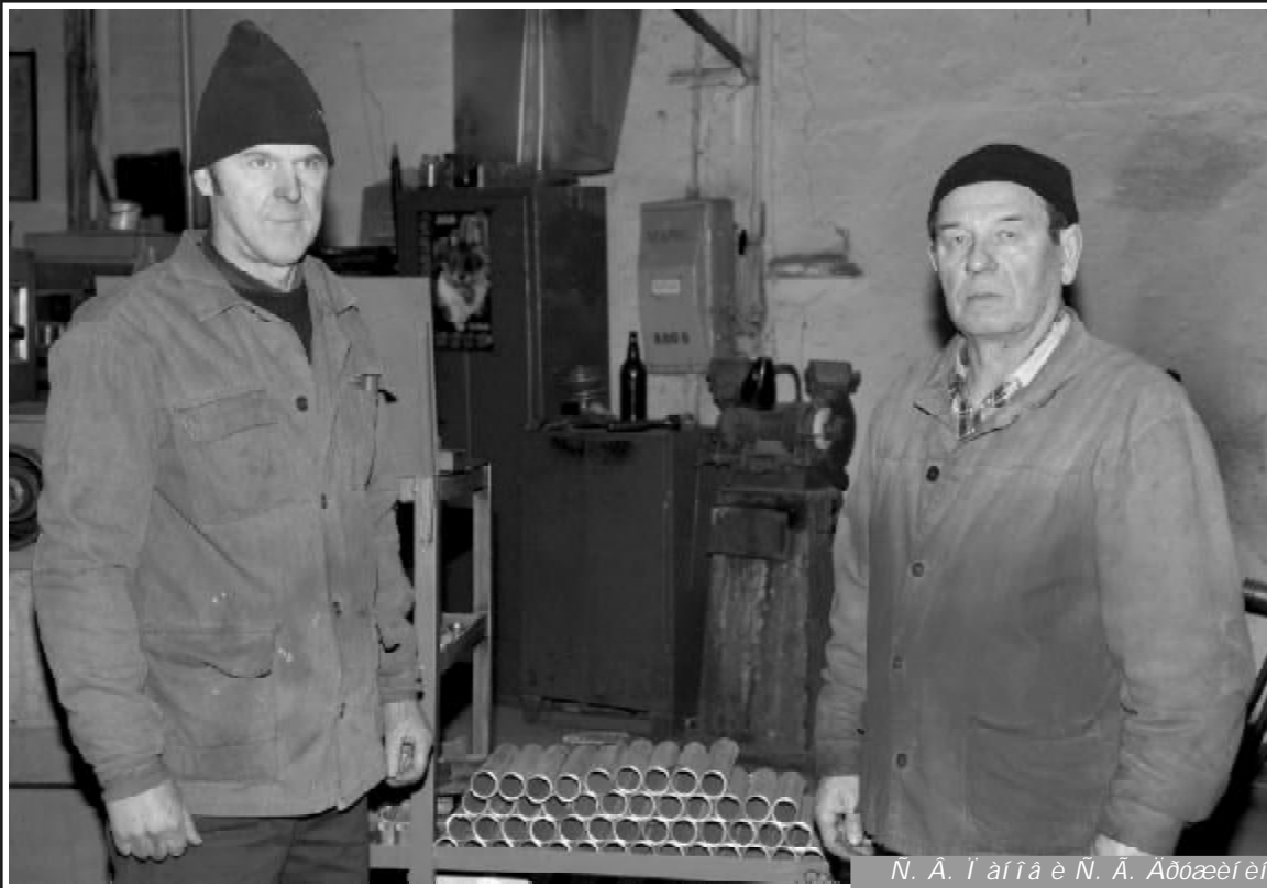
N. A. I aita e N. A. Adaei ei

Выполняемые МЗУ работы приносят значительный экономический эффект. Так, согласно конструктивному изменению были проведены работы, связанные с охлаждением электродов электропечи. В результате проведения всего комплекса мероприятий, в котором были задействованы и другие службы завода, повысилась их стойкость, а тем самым продлился срок службы. Кроме того участком постоянно