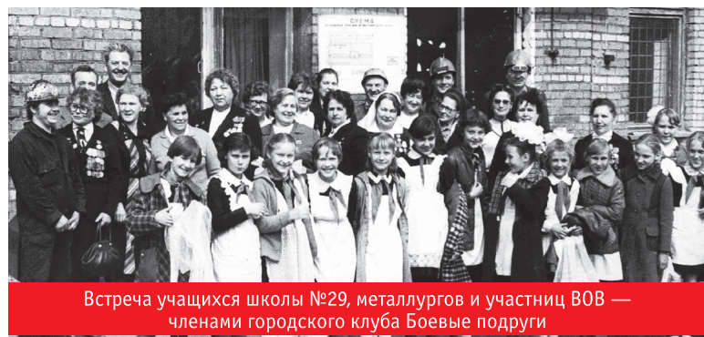
Встреча учащихся школы №29, металлургов и участниц ВОВ — членами городского клуба Боевые подруги

государства вопросов, как патриотическое воспитание молодёжи, защита социально-экономических и правовых интересов ветеранов всех категорий, организация реальной помощи ветеранам в материальном, бытовом обеспечении, медицинском обслуживании, организации культурно-оздоровительных мероприятий, досуга пожилых людей.