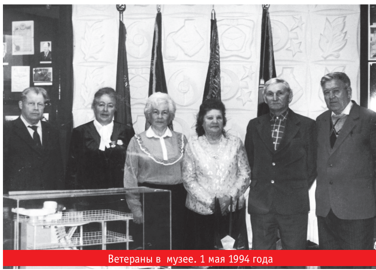
Ветераны в музее. 1 мая 1994 года